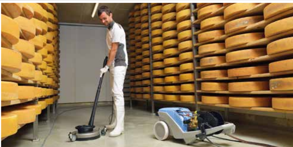
Abb. Non-Marking Ausführung (NoM). Info Seite 68