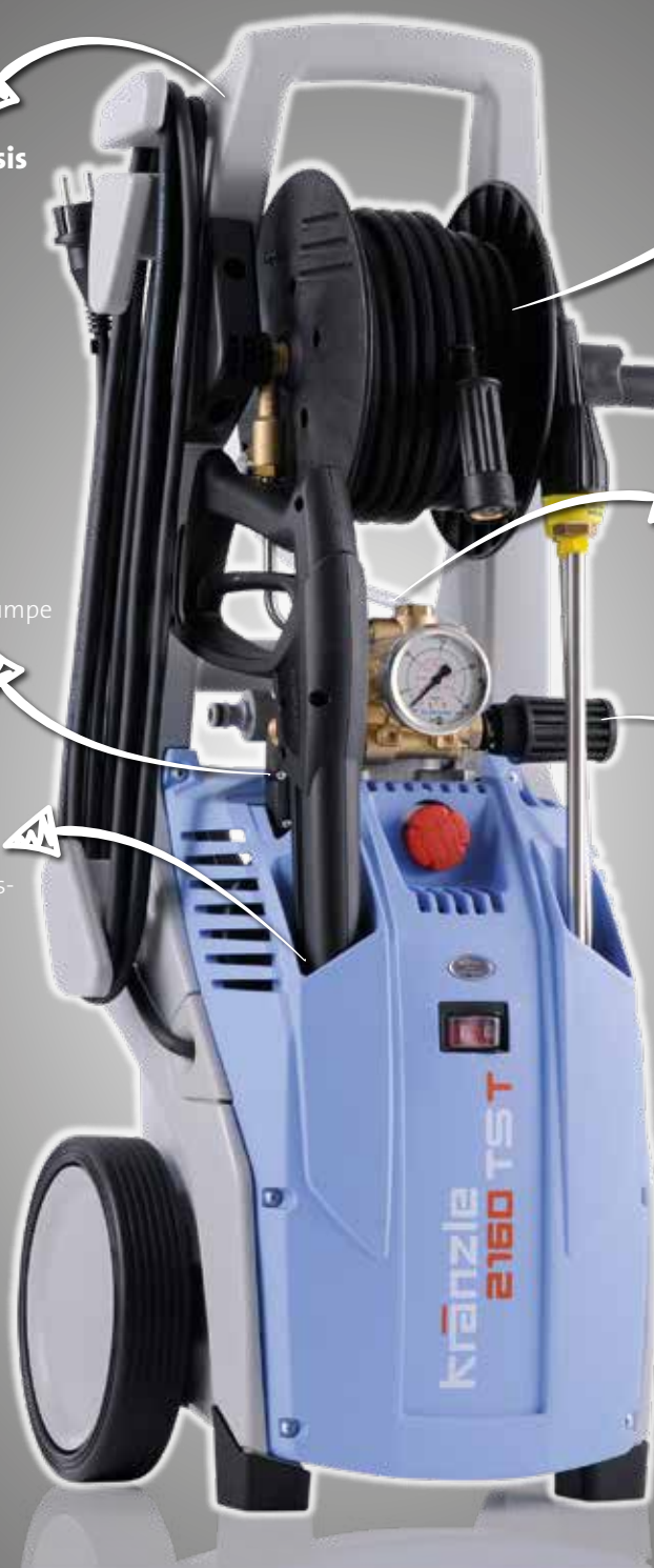
Abbildungen: K 2160 TST