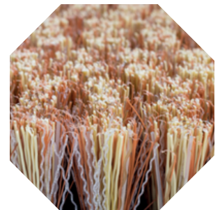
Teller elektrisch leitfähig, Bürstenbesatz mit min. 10 % Phosphorbronze-Anteil.