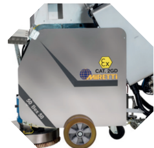
Maschinenkorpus und Tanksystem aus rostfreiem Edelstahl. Strapazierfähig und langlebig auch unter härtesten Einsatzbedingungen.