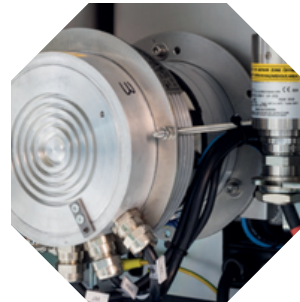
Hohe Saugleistung durch Gekapselte Turbine.