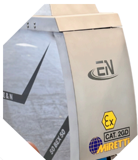
Zertifiziert nach der gültigen Explosionsrichtlinie entsprechend 2014/34/EU-ATEX, für explosionsgefährdete Bereiche der Zonen 1 und 21, Kategorie 2GD.