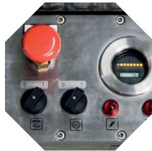
Nutzerfreundliches Bedienfeld mit Not/Aus, Batteriestandskontrolle und Betriebsstundenzähler.